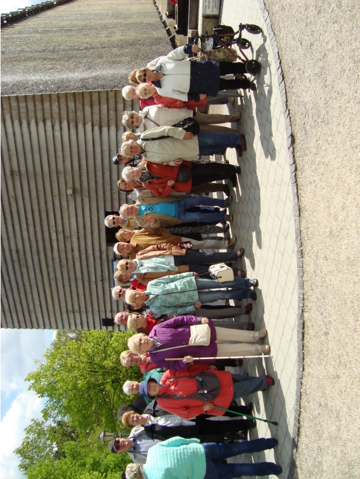
Gruppenbild der Selbsthilfegruppe C.A.L.B.